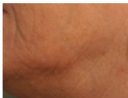
Post 2 treatments